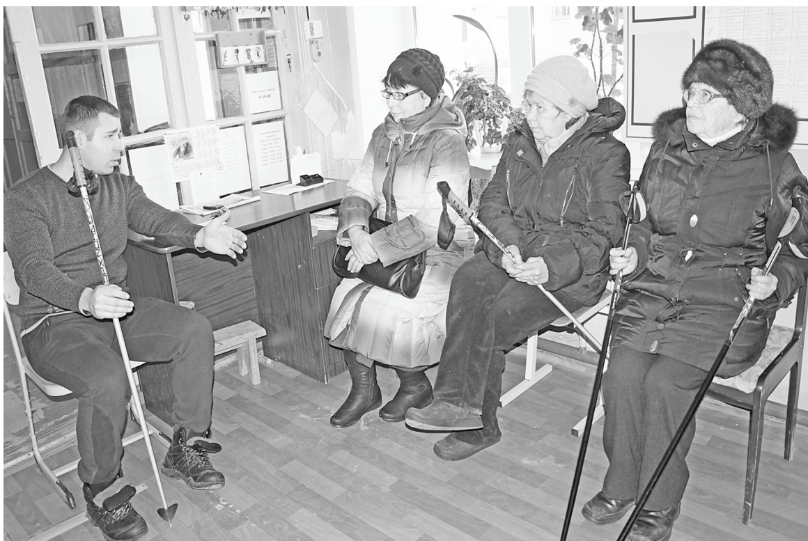
Первый мастер-класс по скандинавской ходьбе был немногочисленным. Но всем, кто его посетил, понравился - узнали много полезного.

Очень важный момент — интенсивность тренировок. Начинающие «скандинавские